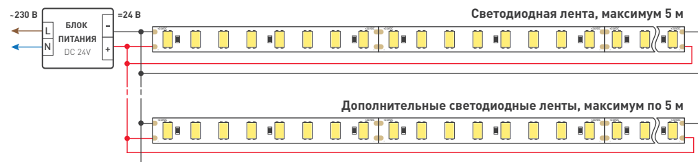
Схема 1. Подключение нескольких светодиодных лент с двух сторон Рекомендуется использовать для обеспечения равномерного свечения ленты по всей длине.

Рекомендуемая схема параллельного подключения питания.