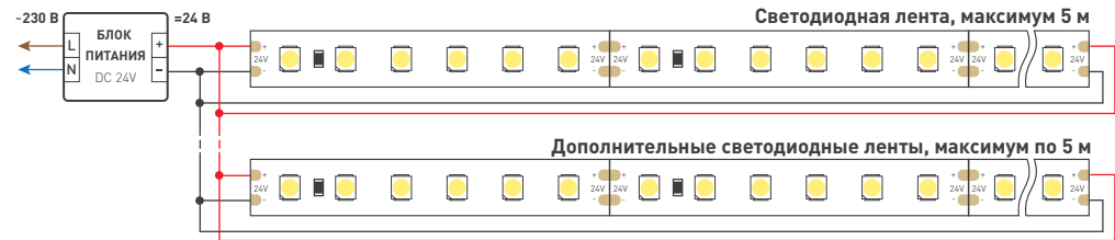
Схема 2. Подключение нескольких светодиодных лент с двух сторон для обеспечения равномерного свечения ленты по всей длине